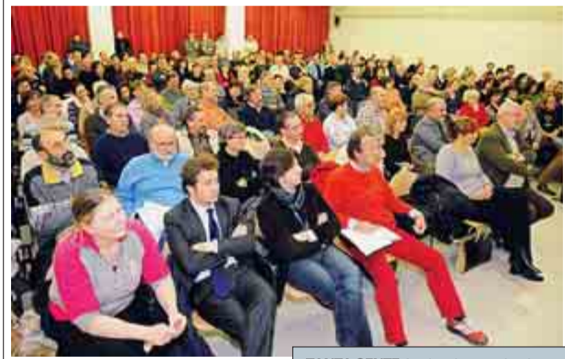
TANTA GENTE Applausi scroscianti